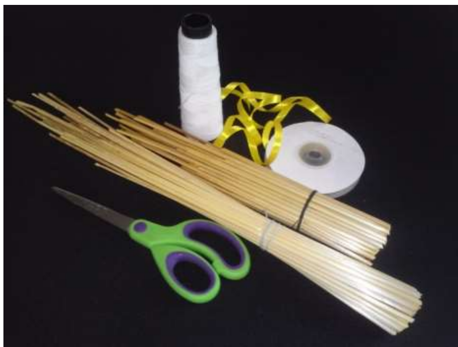
Инструменты и материалы